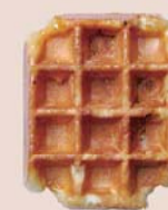
クルミ キャラメリゼ