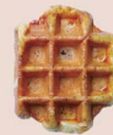
オレンジ アールグレイ