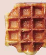
発酵バター プレーン