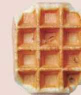
メイプル シュガー